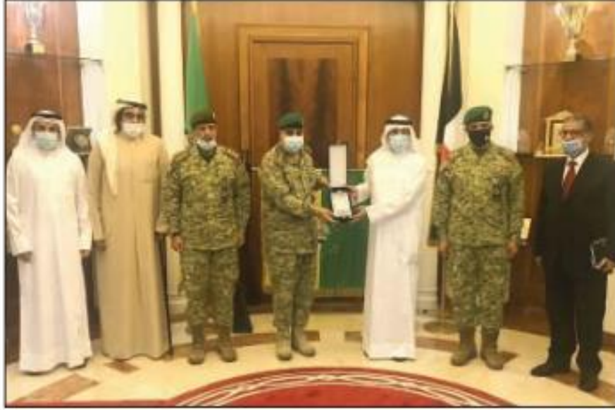
ممثلو الجامعة المفتوحة وقياديو الحرس الوطني

الوطني بدرجة وزير، مشيدا بجهود ودور الحرس الوطني ومساهمته الفاعلة بإدارة أزمة جائحة «كورونا» مع المؤسسات الحكومية المسند إليها هذا الدور على أكمل وجه.